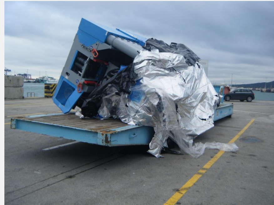
PUERTO DE ALGECIRAS