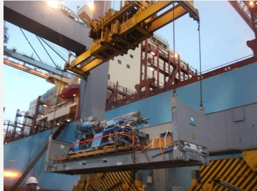
PUERTO DE MONTEVIDEO